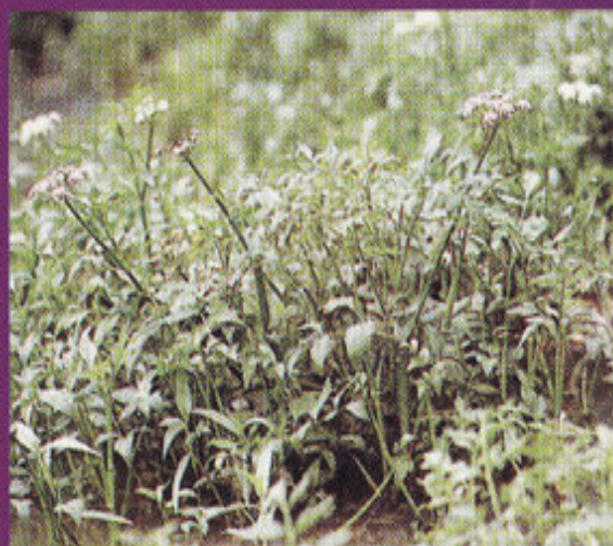
Pokok selom tumbuh meliar di atas paya.

Selom biasanya tumbuh liar di tempat-tempat lembab seperti di tepi paya dan sawah tetapi kini ia ditanam secara teratur untuk kegunaan harian dan untuk jualan di pasar. Ia mengandungi banyak zat terutama vitamin C dan zat galian. Ia senang ditanam dan mudah dijaga.